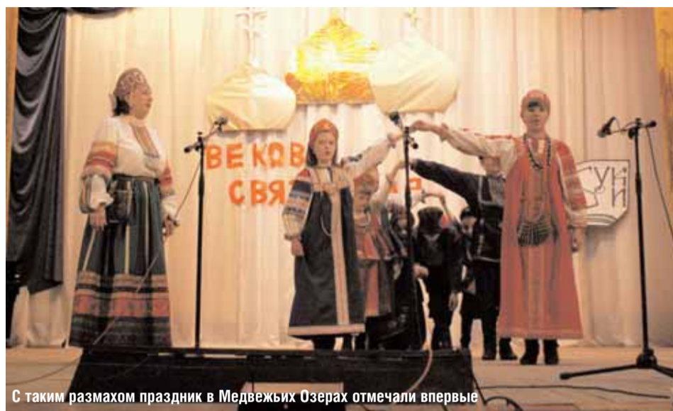
С таким размахом праздник в Медвежьих Озерах отмечали впервые

участие школьники, воспитанники православной группы Детского сада № 31 «Радуга», которые представили отрывок из программы своего выпускного вечера, известные не только в области, но и за ее пределами музыкальные коллективы, церковные хоры Троицкого собора и церкви блаженной Ксении Петербургской.