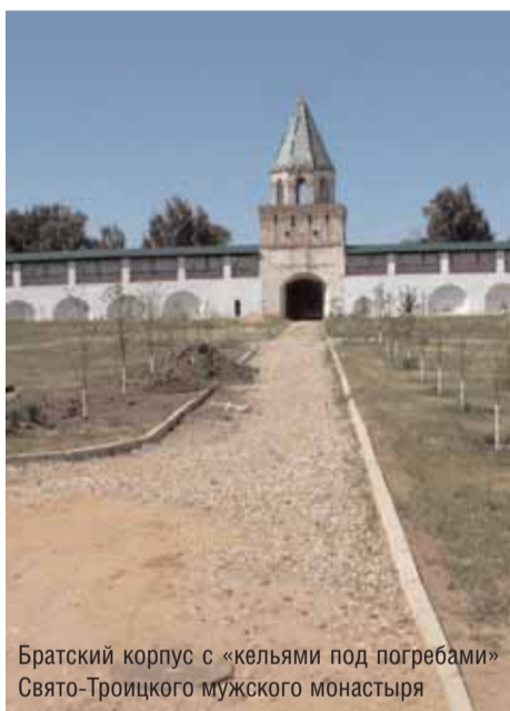
Братский корпус с «кельями под погребями» Свято-Троицкого мужского монастыря