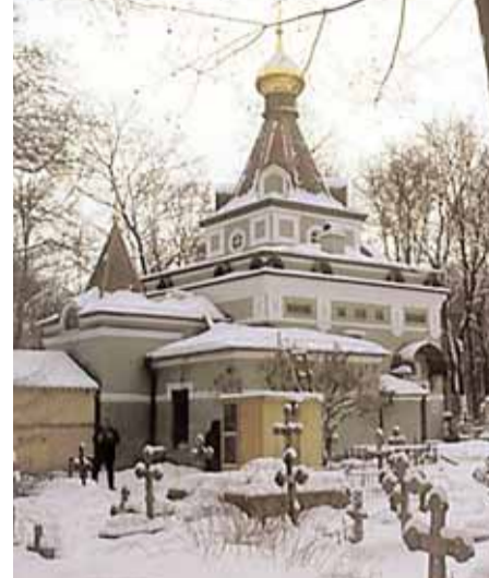
Часовня блаженной Ксении Петербургской на Смоленском кладбище

Смоленском кладбище) была со временем воздвигнута каменная часовня, которая и по сей день служит одной из святынь Петербурга, привлекающей многочисленных паломников.