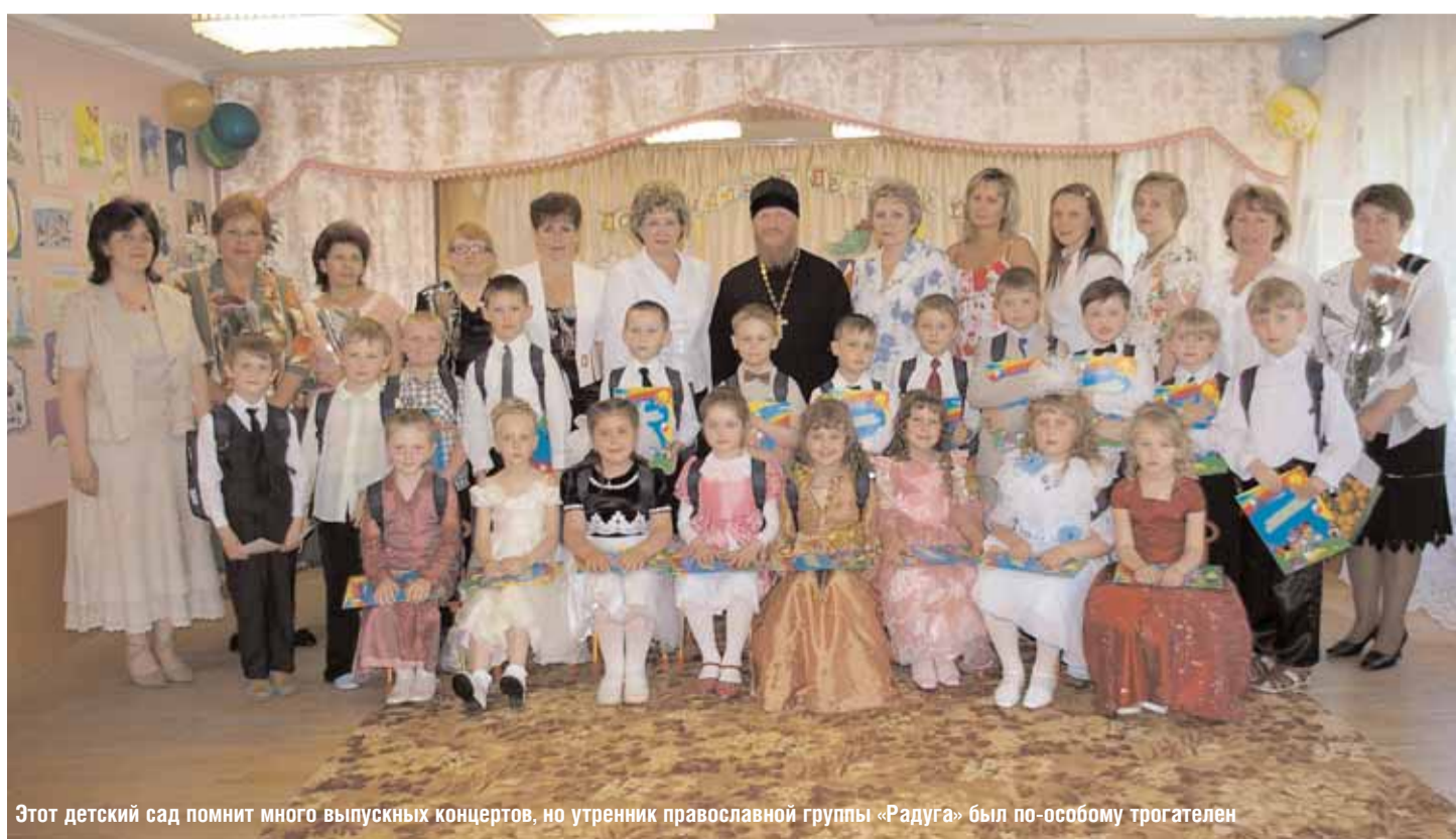
Этот детский сад помнит много выпускных концертов, но утренник православной группы «Радуга» был по-особому трогателен