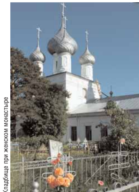
Кладбище при женском монастыре