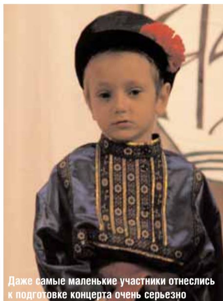
Даже самые маленькие участники отнеслись к подготовке концерта очень серьезно

Отмечаемый ежегодно 24 мая День славянской письменности и культуры неразрывно связан с именами святых равноапостольных Кирилла и Мефодия, создателей славянского алфавита. После многих лет забвения праздник возродили в 1986 году, а с 1991 года День славянской письменности и культуры является единственным в России не только церковным, но и государственным праздником.