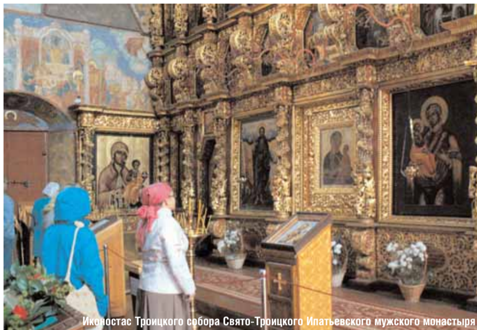
Иконостас Троицкого собора Свято-Троицкого Ипатьевского мужского монастыря

Ранний подъем, дальняя дорога, и вот мы въезжаем в один из древнейших городов России — Кострому, которая младше Москвы всего на пять лет. В ней сохранилось много старинных построек: торговые ряды, пожарная башня, особняки. В городе нет высотных зданий, и когда в него въезжаешь, кажется, что попадаешь на страницы русских классиков.